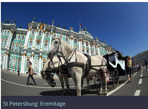
St Petersburg: Eremitage